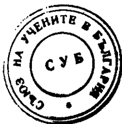
Чл.-кор. Д. Дамянов, Председател на СУБ